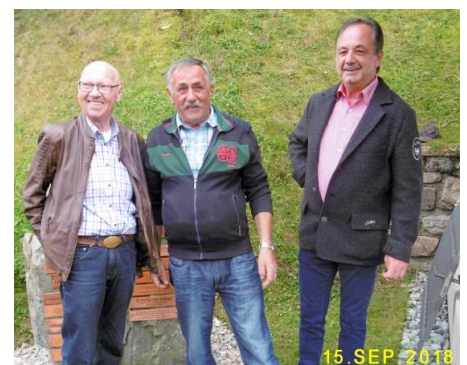
Die drei Hauptakteure

Im Anschluss wird eine reichhaltige Agape mit jeder Menge Brötchen und Getränken angeboten und es wird kräftig zugelangt. Nach 16:00 löst sich die Festgemeinde auf, der nächste Treffpunkt ist um 16:30 das Gasthof Perfler in Außervillgraten.